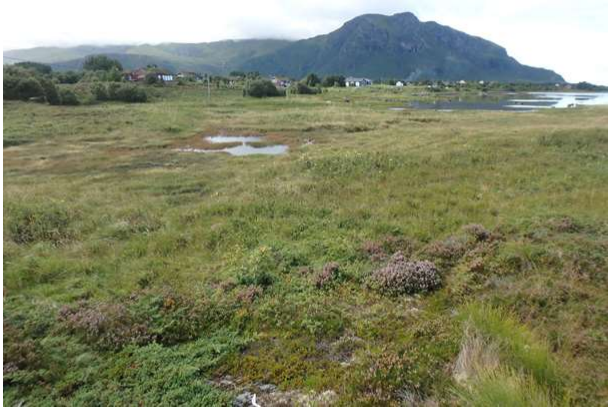
Figur 14. Bildet er tatt mot vest fra en av haugene nord og litt øst for planområdet. Hytta mot venstre bildekant er den nordøstre i eksisterende hyttefelt. Helt i bakgrunnen på høyre side ligger vegen utover mot Kråkholmen. Som vi ser er strandområdene påvirka av bebyggelsen langs hele strekninga.