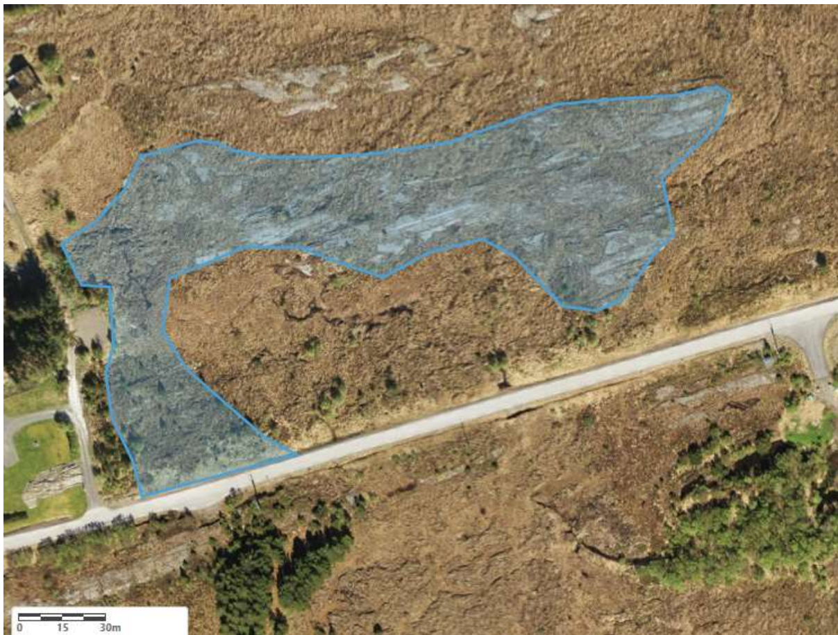
Figur 15. Flyfotoet viser avgrensingen av Marholmslættet 1.