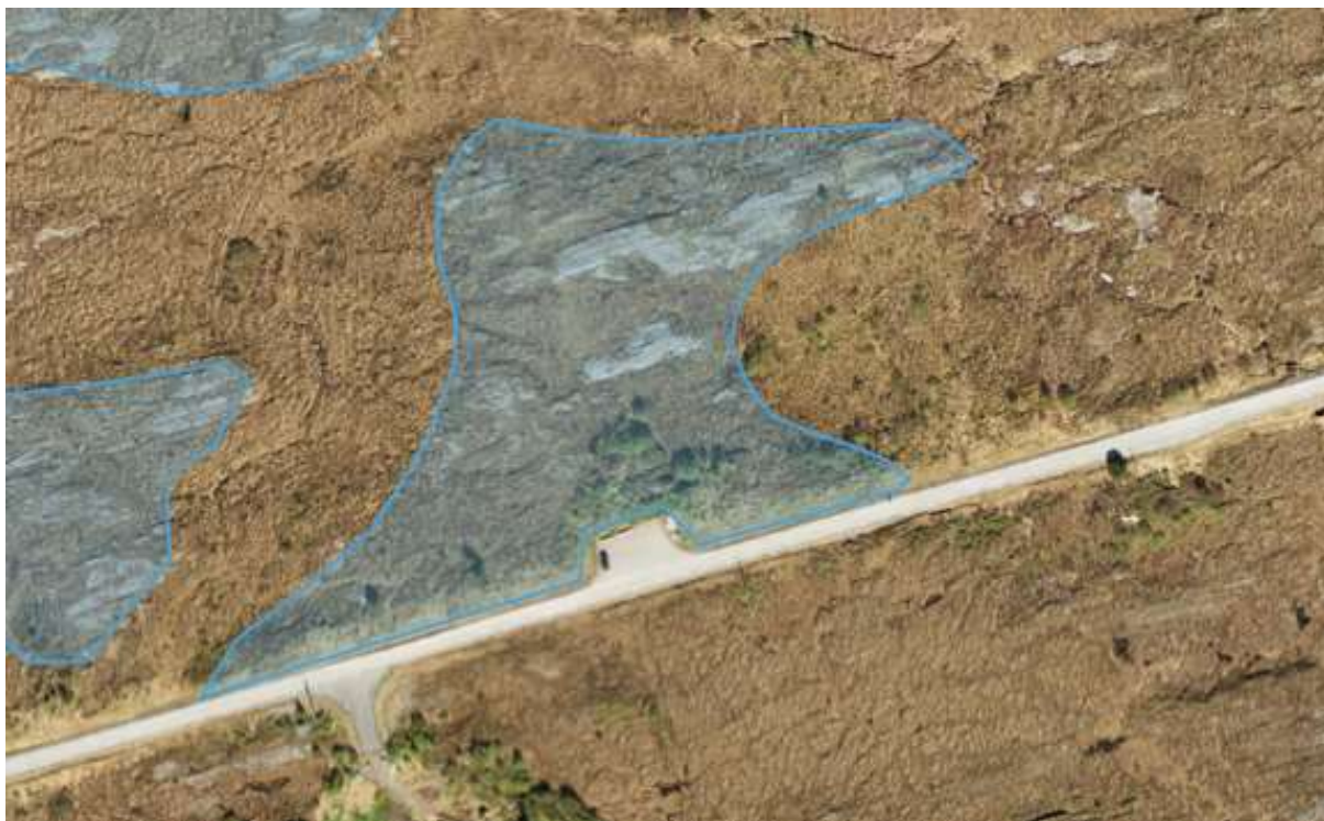
Figur 16. Flyfotoet viser avgrensinga av Marholmslættet 2.

Verdivurdering: Faktaark for kystlynghei av 07.08.2015 er lagt til grunn. Størrelse (Ca. 12 dekar) oppnår så vidt lav vekt. Tilstand (et godt stykke ut i tidlig gjenvekstsuksessjonsfase) oppnår så vidt lav vekt. På de andre kriteriene nås ikke terskelverdi. Dette gir en svak verdi C.