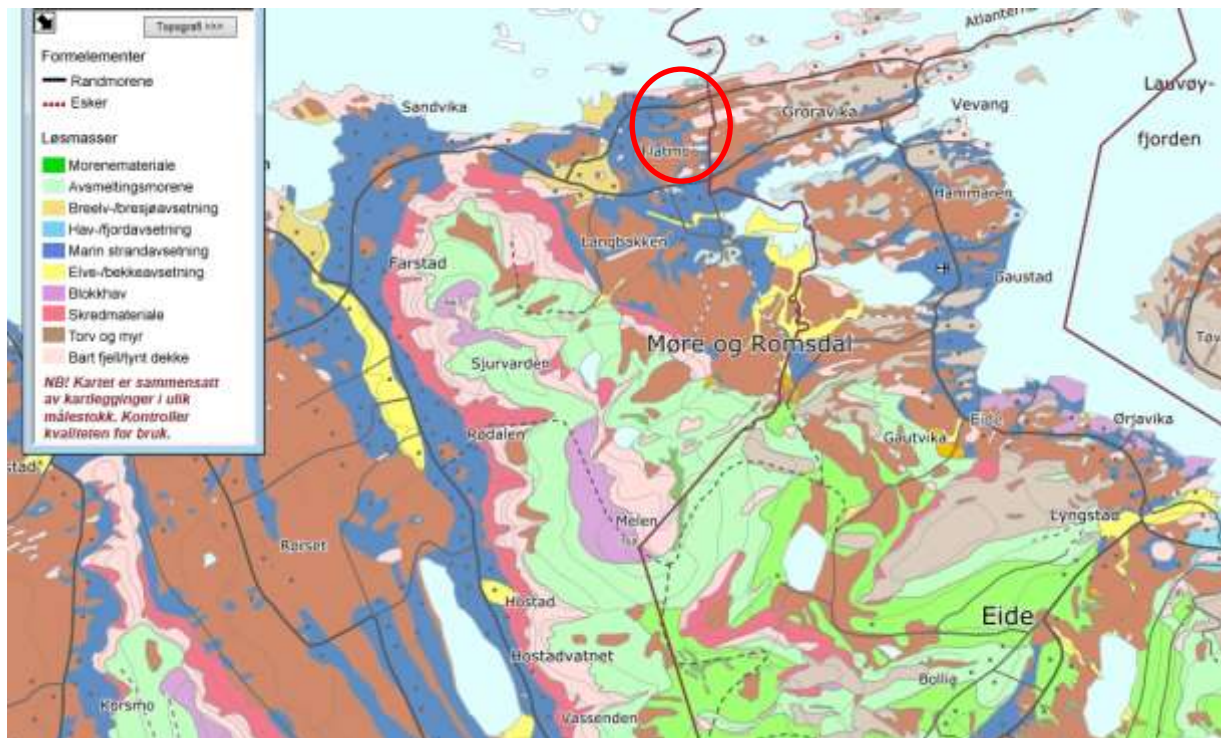
Figur 5. Lausmassekart for undersøkelsesområdet. Kartet er grovt, men viser de viktigste trekkene i fordelingen av lausmasser. Områdene med rosa farge er for det meste bart fjell, grønt er morene, blått er marine avsetninger, brunt er torv og myr, og gult er elveavsetninger. Som en ser er det lite morenemasser innen undersøkelsesområdet, men noe bart fjell, torv og myr samt marine strandavsetninger.