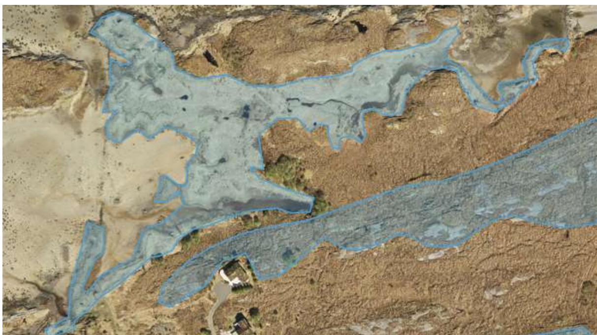
Figur 18. Flyfotoet viser avgrensingen av Marholmsletta 4 (Det lyseblå området).

Verdivurdering; Faktaark for strandareal av 06.11.2014 er lagt til grunn. Størrelse (Ca. 17 dekar) oppnår middel vekt. Tilstand (et godt stykke ut i tidlig gjenvekstsuksesjonsfase) oppnår lav vekt. På artsmangfold er det påvist 15 kjennetegn-/tyngdepunktsarter i et større område, men bare 5 av disse sikkert innafor lokaliteten. Verdien settes til C. Det er mulig at ytterligere undersøkelser kan gi verdi B.