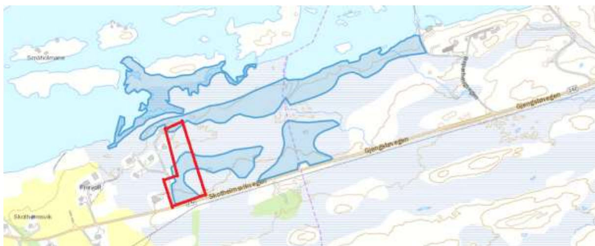
Figur 4. Planområdet omtrentlig inntegna med rødt. Blå områder er nye naturtypelokaliteter avgrensa etter undersøkelser gjort i forbindelse med dette prosjektet. Alle de avgrensa lokalitetene har fått verdi C, dvs. lokalt viktige.