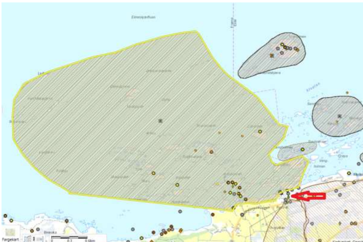
Figur 8. Nordvest for planlagt hytteområde er det et funksjonsområde for vilt. Kartet er hentet fra Gislink med kartblad funksjonsområde. Polygonet med gult omriss viser Funksjonsområdet Skotheimsvika. Bakgrunnskart er ...