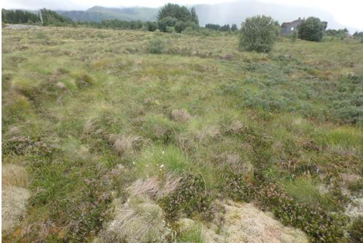
Figur 6. Fotoposisjon 32VMQ1075786886 omtrent i nordøstre hjørnet av planområdet, sett mot eksisterende hyttefelt. Det er strukturer i myra som viser at det er tatt ut torv.