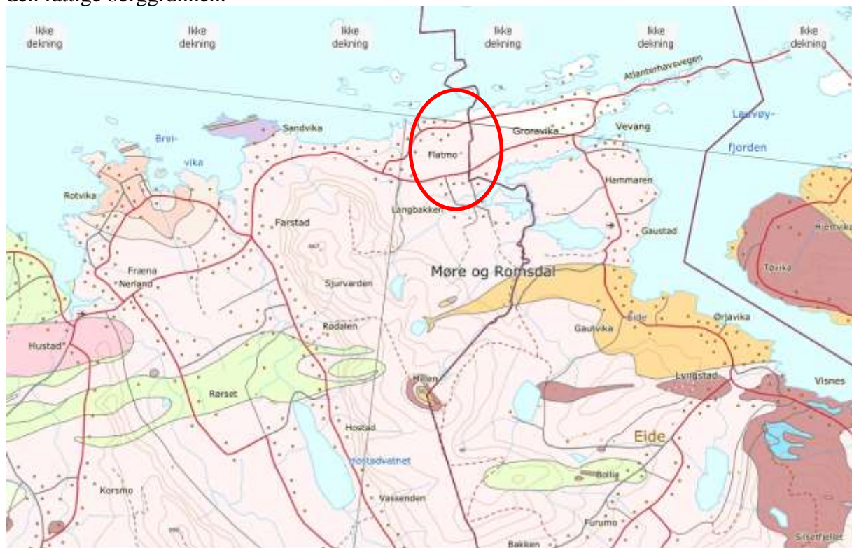
Figur 4. Berggrunnskart med undersøkelsesområdet markert med en rød oval. Berggrunnen i området består utelukkende av gneis ifølge dette berggrunnskartet. Med såpass fattig berggrunn kan en ikke vente særlig stort artsmangfold av noen vegetasjonsgrupper innen undersøkelsesområdet.

I følge berggrunnskartet består berggrunnen i denne delen av Fræna utelukkende av gneis – ikke inndelt. Bergartene i det undersøkte området tilhører stedegne eller nær stedegne bergarter fra jordas urtid (proterozoikum), for det meste deformert og omdanna under den kaledonske fjellkjedefoldinga (NGU). Registreringene av karplanter stemte bra med det som var forventet ut fra den fattige berggrunnen.