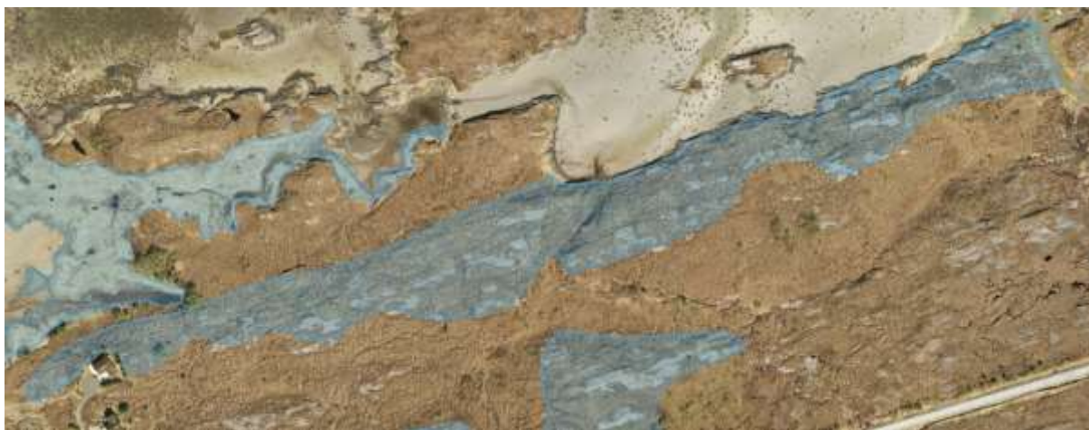
Figur 17. Flyfotoet viser avgrensinga av Marholmslættet 3.

Verdivurdering; Faktaark for kystlynghei av 07.08.2015 er lagt til grunn. Størrelse (Ca. 30 dekar) oppnår lav vekt. Tilstand (et godt stykke ut i tidlig gjenvekstsuksjonsfase) oppnår så vidt lav vekt. På de andre kriteriene nås ikke terskelverdi. Dette gir en svak verdi C.