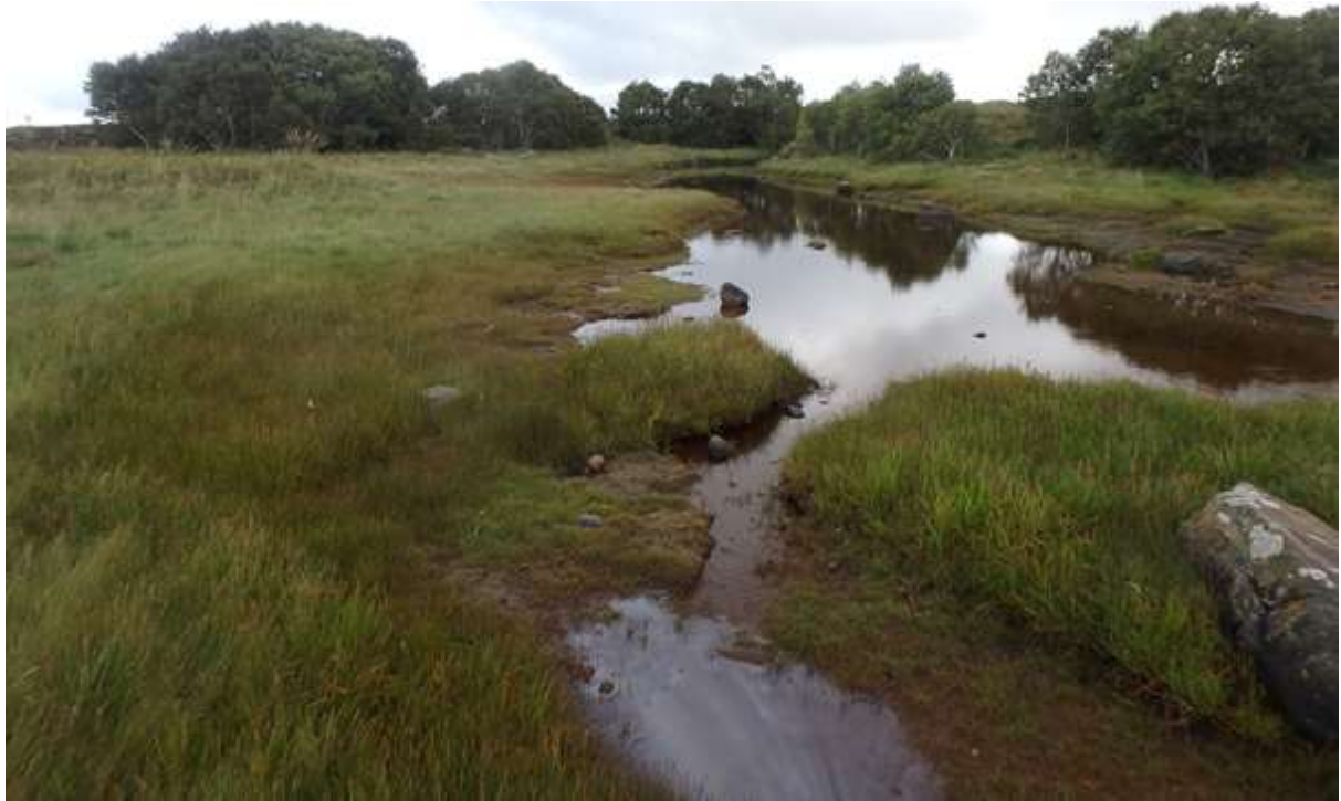
Figur 7. Strandengområder rett på nordsida av planområdet som ligger umiddelbart bak trærne i høyre kant.