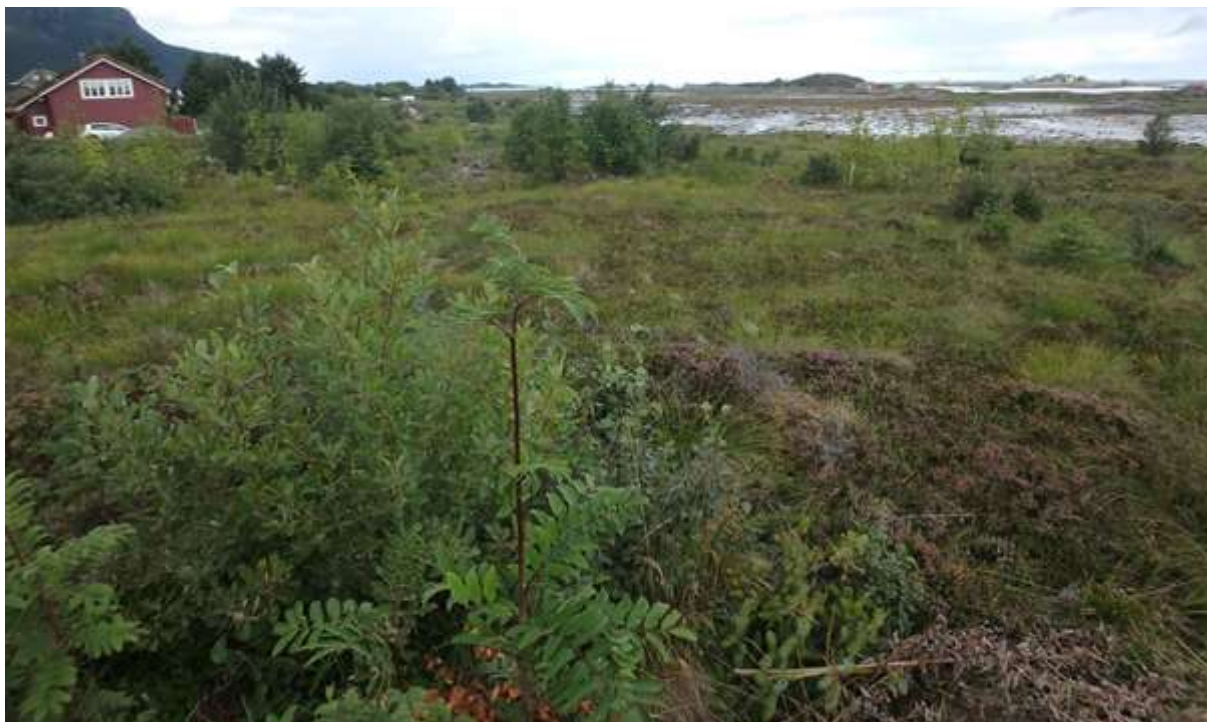
Figur 12. Bildet er tatt omtrent fra nordøstre hjørne av planområdet. Området bak til høyre viser leira med vannstand mellom flo og fjære.