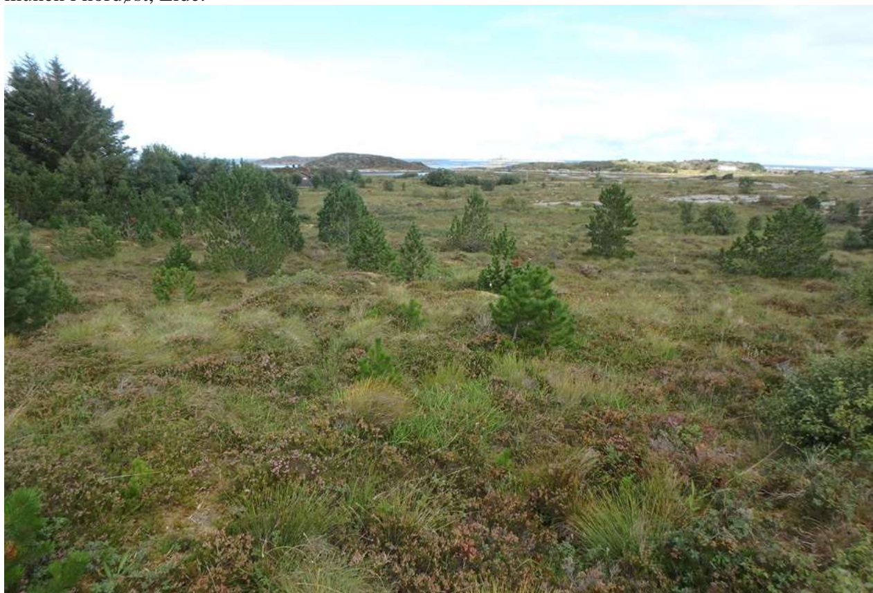
Figur 2. Restene av kystlyngheia gror nå til, særlig med bergfuru.

For fugl og pattedyr har vi konkludert med at tiltaket kan ha inntil middels negative konsekvenser for de to fugleartene storspove og vipe. For de andre fugleartene vi har vurdert regner vi de negative konsekvensene som små/ubetydelige. Det er mulig at det planlagte tiltaket vil ha noen negative konsekvenser for oter, da det sannsynligvis befinner seg ynglende oter innen influensområdet. Det kan også være mulig/sannsynlig at den samlede belastningen, spesielt på fuglelivet kan forsterke og etter hvert medføre negative konsekvenser for andre arter også enn de som er nevnt her. Vi tenker da mest på ytterligere hyttebygging nær strandsonen, samt den byggingen som foregår i nabokommunen i nordøst, Eide.