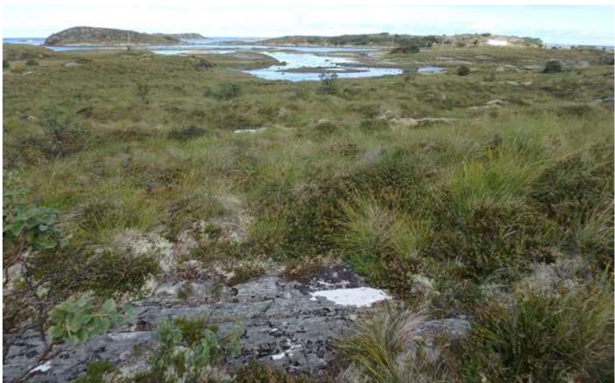
Figur 11. Bildet er tatt fra litt nordøst for planområdet og viser områdene mot nord. Sentralt i bildet er det leire og strandeng som i stor grad henger sammen helt til Skotheimsvika.