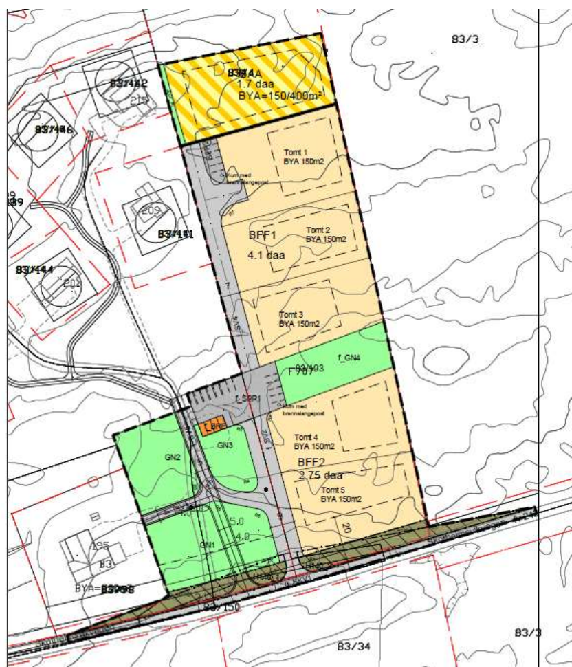
Figur 5. Reguleringsplankart versjon 05.01.2018.