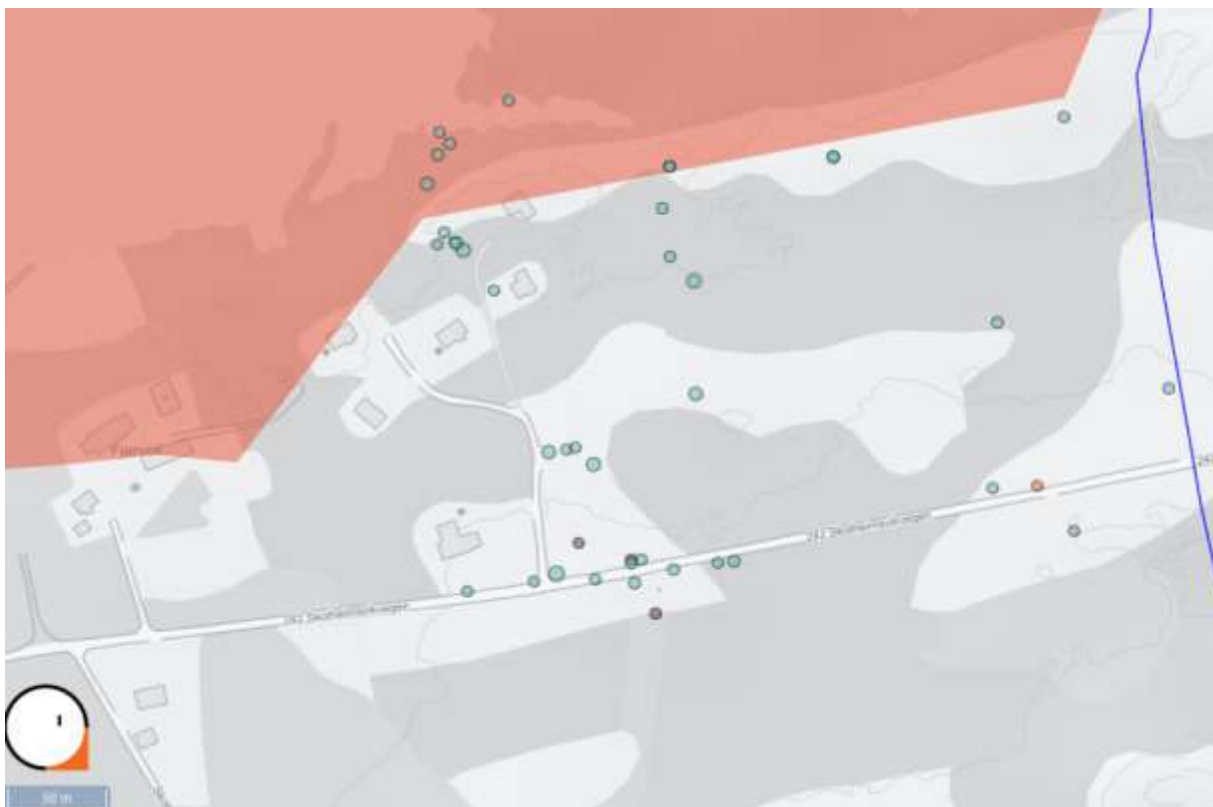
Figur 10. Skjermdump fra artskart 19.09.2018. Punkt representerer både eldre observasjoner og de som ble gjort 13.08.2018. Lys grå skravur sammenfaller ganske godt med kystlynghei, mørkere med torvmark. Det rosa feltet markerer grovt det som er regnet som funksjonsområdet for fugl. Den blå streken helt til høyre markerer grensa mot Eide kommune.