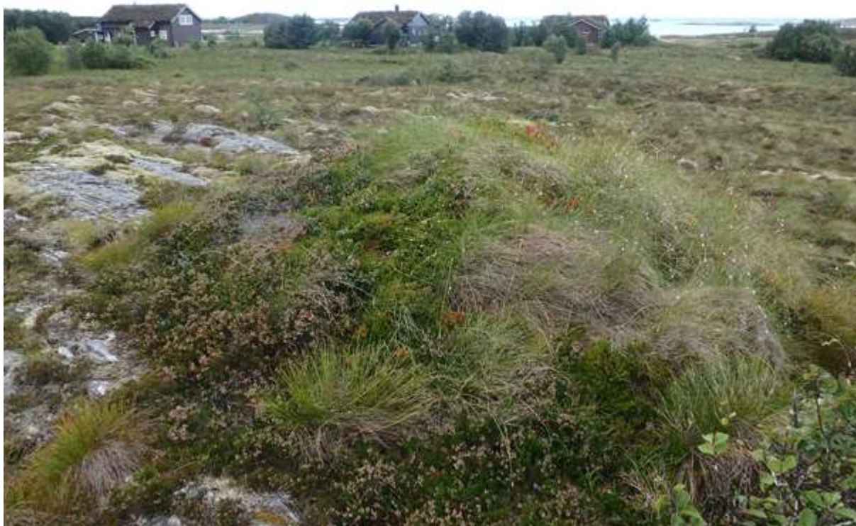
Figur 13. Bildet er tatt fra en av haugene på østsida av planområdet, i retning mot eksisterende hyttefelt. I framkant en torvhaug. Vegetasjonen er litt annerledes enn rundt, som følge av virkningen av fuglegjødsling og matrester som bygger seg opp over lang tid ved aktiv bruk. Bruken av denne «ørntua» er tydelig mindre nå enn tidligere. Noen av disse haugene hadde ellers en størrelse som tyder på at det har blitt liggende igjen torv på toppene, selv om torva ellers har vært tatt til brenntorv.