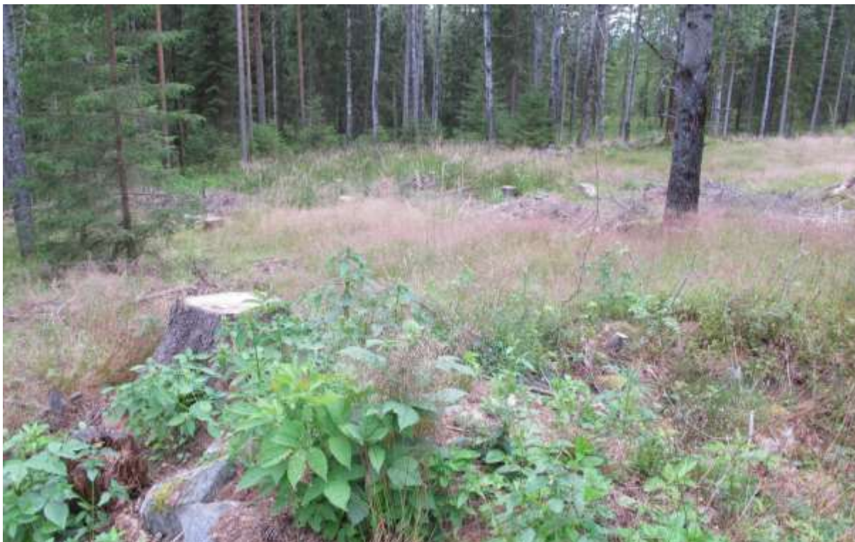
Figur 6. Helt vest i lokaliteten er det i løpet av de siste årene hogd ut en del gran. Her er det stort oppslag av snerprørkvein, men også noe rødhyll, som kan bli et betydelig problem om den ikke bekjempes. I dette området vil en anbefale at det slås to ganger per sesong, samt at nye oppslag av skog holdes nede.