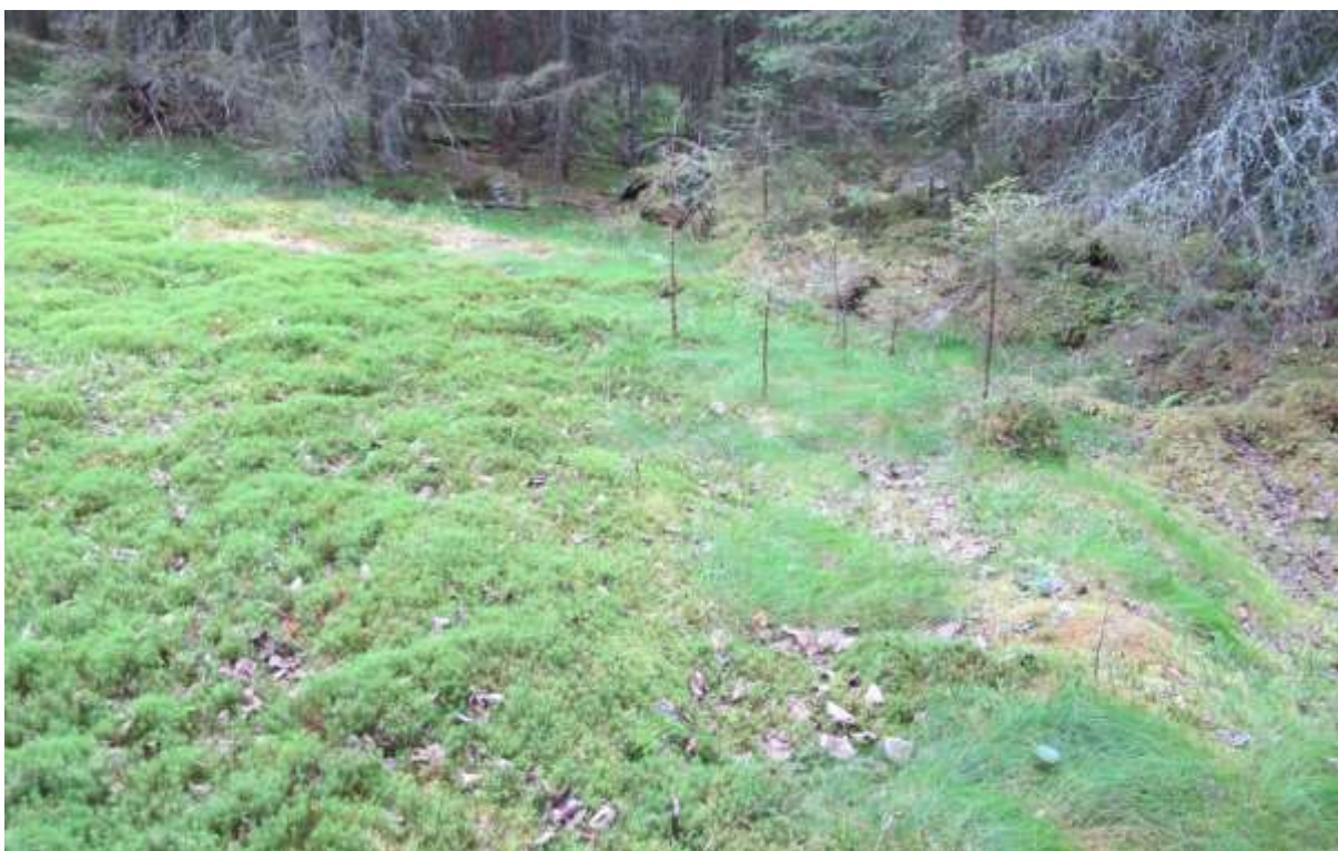
Figur 5. Helt i sør er det et svært tydelig skille mellom skogen og de engene som fremdeles er åpne. Her finnes en del storbjørnemose i et belte langs kanten. Under grana til høyre i bildet skimtes ei rydningsrøys.