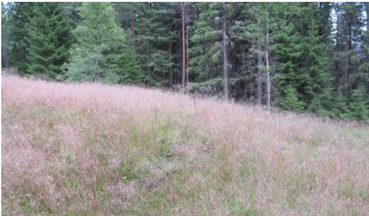
Figur 4. Sentrale deler av lokaliteten består av mye smyle og sølvbunke. Legg merke til hvor tett skogen står langs kantene.