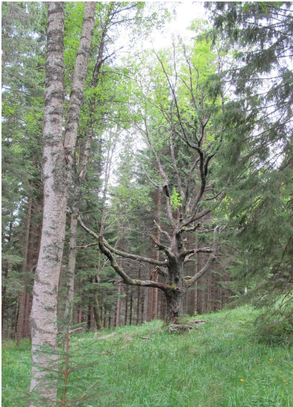
Figur 10. Sør i lokaliteten finnes arealer med restaurerbar slåttemark der skogen mer eller mindre har tatt over. her står noen imponerende gamle bjørketrær som er viktige elementer i det gamle kulturlandskapet på Nybakk.