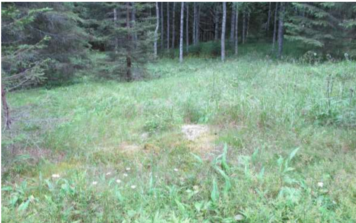
Figur 8. Helt sør i lokaliteten er skogen på vei inn, men det finnes fremdeles arealer med restaurerbar slåttemark. Blant annet finnes gode forekomster av flekkgrisøre, prestekrage, skogstorkenebb og hvitbladtistel.