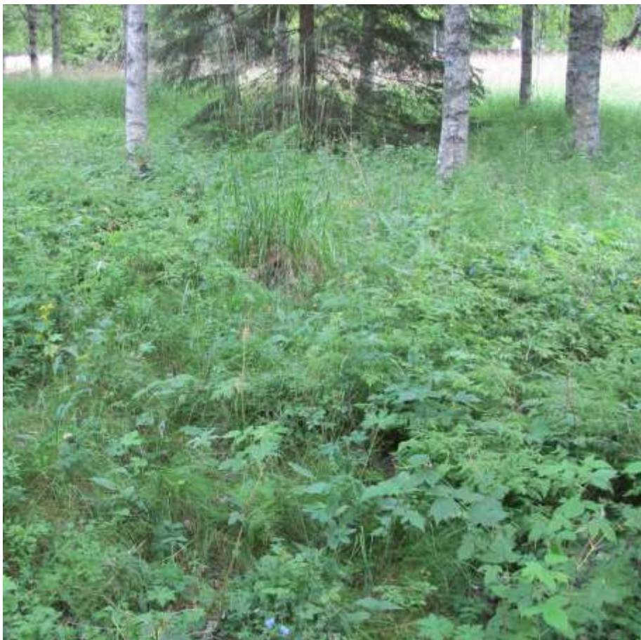
Figur 9. Mer av arealene i sør. Her ser en samtidig at mye av dette arealet er lysåpent, har gode innslag av engarter, og dermed egner seg godt til restaurering. Legg merke til at det står snerprørkvein her (det høyvokste gresset sentralt i bildet). Om all skogen fjernes samtidig, kan denne arten bli svært dominerende om den ikke fjernes. Denne arten bør derfor slås tidlig, og fjernes umiddelbart, slik at den ikke gis anledning til å frø seg. I bakgrunnen skimtes noe av engarealene vest i lokaliteten. Disse er mer dominert av sølvbunke, og her kan beite med hest være en måte å fjerne tuene på. I så fall må hesten(e) gjerdes ute på enga og ikke på resten av lokaliteten.