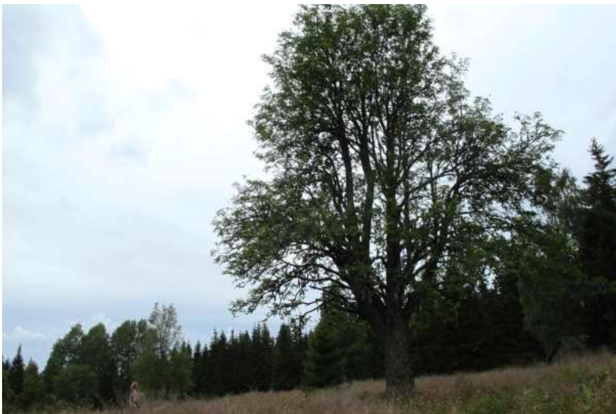
Figur 7. Vest i lokaliteten står ei imponerende rogn. Stammeformen på treet antyder at lokaliteten i tillegg til slått også kan ha vært brukt til beite.