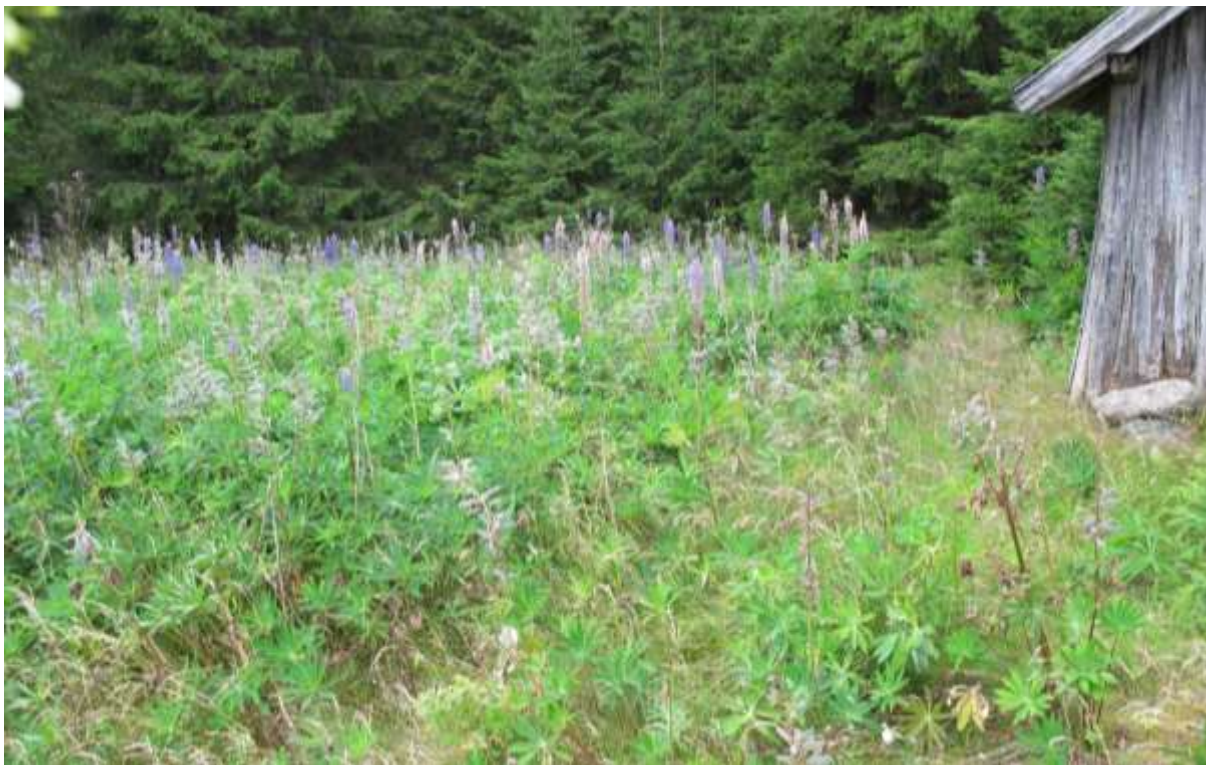
Figur 6. Hagelupiner i spredning nord i lokaliteten bør bekjempes. Noen fantes også ved parkeringsplassen. Legg også merke til den tette granskogen som omkranser deler av lokaliteten.