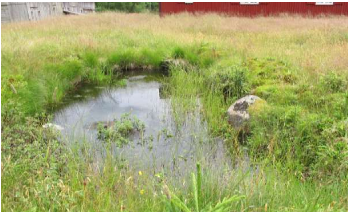
Figur 5. Rundt den vesle dammen like ved husene finnes noe mer fuktkrevende vegetasjon, og her kan det godt stå igjen en liten kantzone, særlig om området beites.