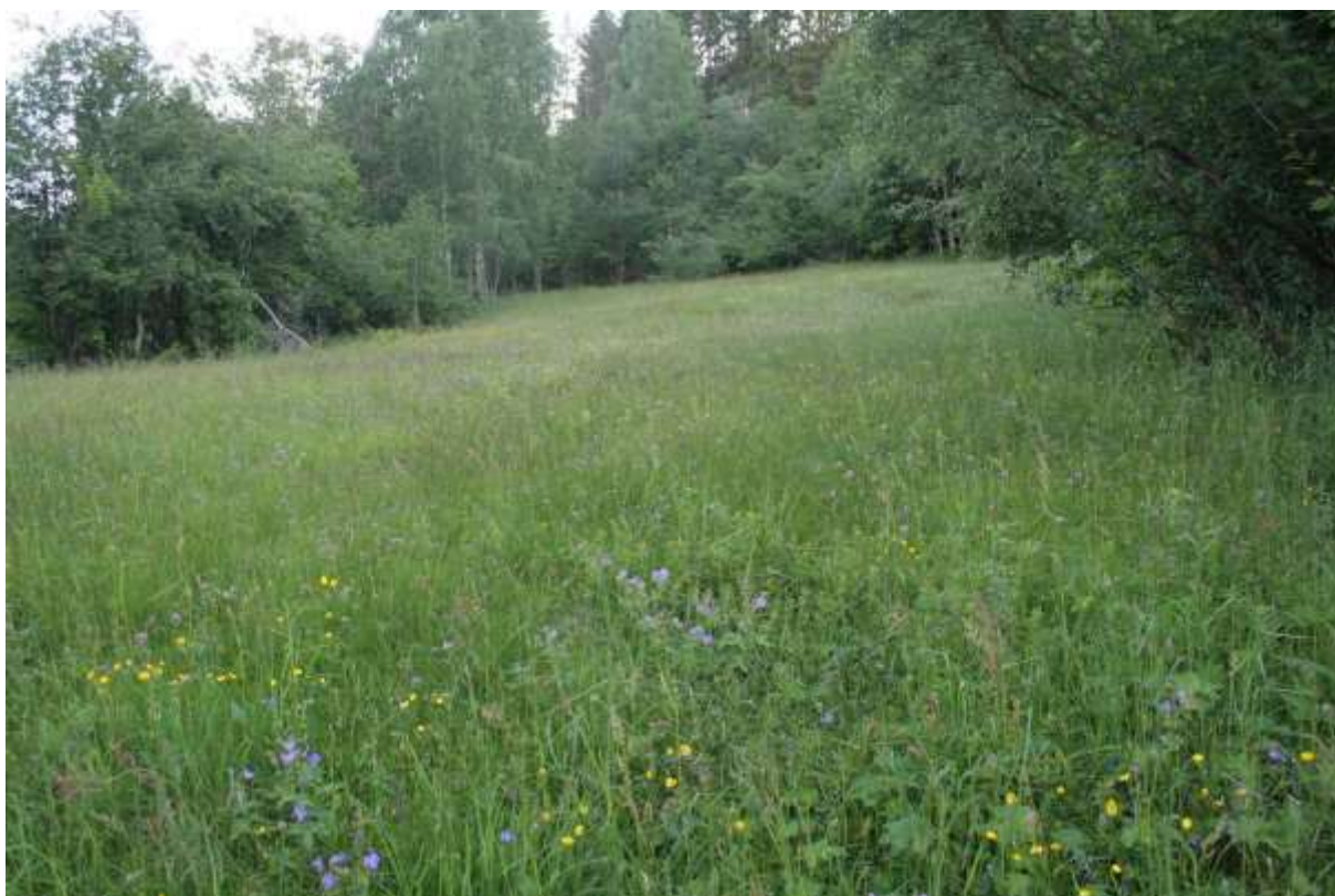
Figur 3. Lokaliteten Hestebeitet. Lokaliteten hadde nok ikkje så mykje av slåttemarksstrukturen i behald, men var likevel ganske artsrik med ganske mange naturengplantar.