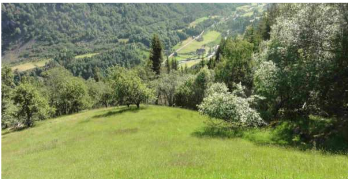
Figur 5. Her ser vi noko av Prestkornrobber på Instegjera. Lokaliteten har hatt feil skjøtsel ein periode, men det hadde tydeleg vore lite gjødsla og nitrofile artar fanst knapt. Slåttemarkstrukturane var i alle fall delvis intakt, sjølv om ikkje artsmangfaldet var spesielt stort. Lokaliteten er vurdert å ha eit ganske godt potensial for beitemarkssopp.