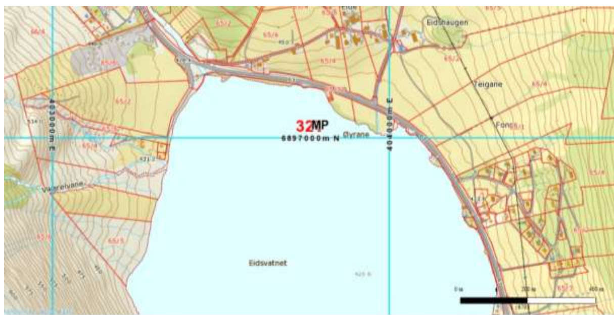
Figur 6. Vi såg på alle teigane som er merka gnr 65/2 på dette kartet, men ingen av dei var i nærleiken av å vera aktuelle som den prioriterte naturtypen, slåttemark. (Kjelde; Gislink).

På Eide ved nordenden av Eidsvatnet lukkast det ikkje å få tak i brukar/eigar, slik at vi måtte sjå på alle teigane som tilhørde bnr 2 av Eide.