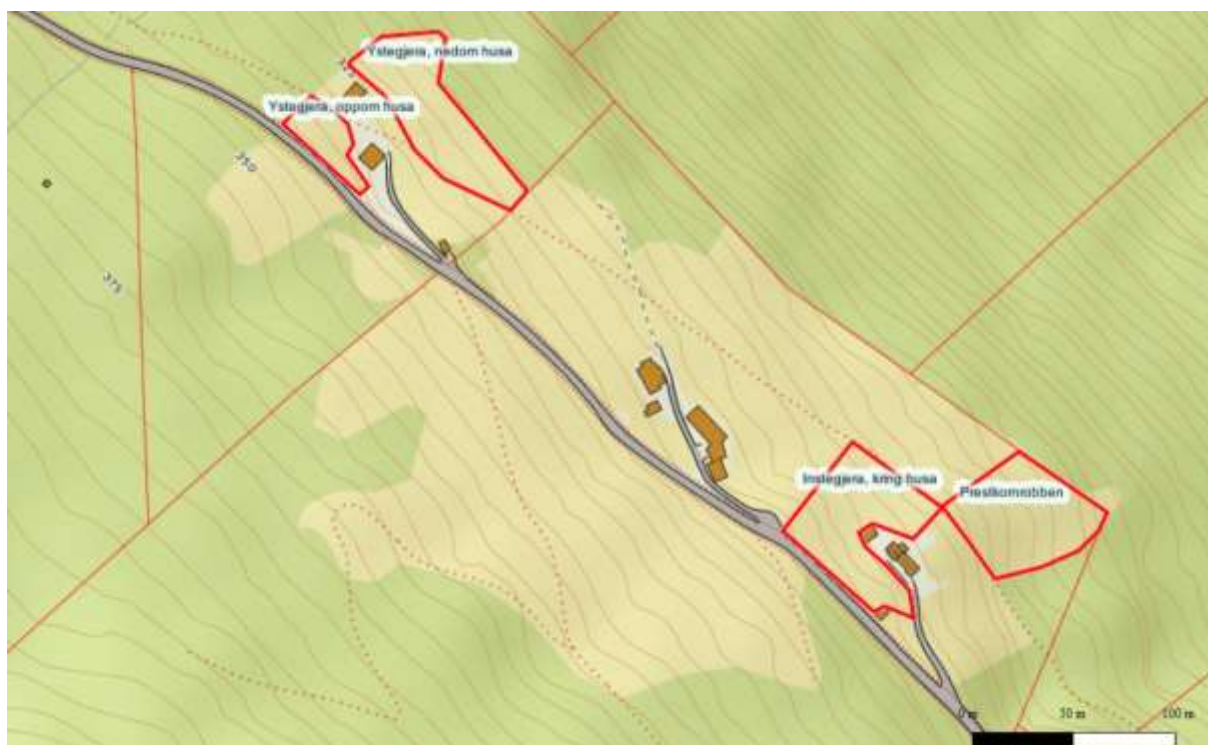
Figur 4. Kartutsnittet viser dei fire lokalitetane på Gjerda som vi meiner i det minste har ein B-verdi som slåttemarksnaturtypar og difor er kvalifisert til å få skjøtelsesplanar utarbeidd.

Også fem-seks andre slåttemarkar vart undersøkt, men som vart vraka, mest fordi dei var for oppgjødsla og dominert av nitrofile artar. Tre av desse låg på oversida av vegen.