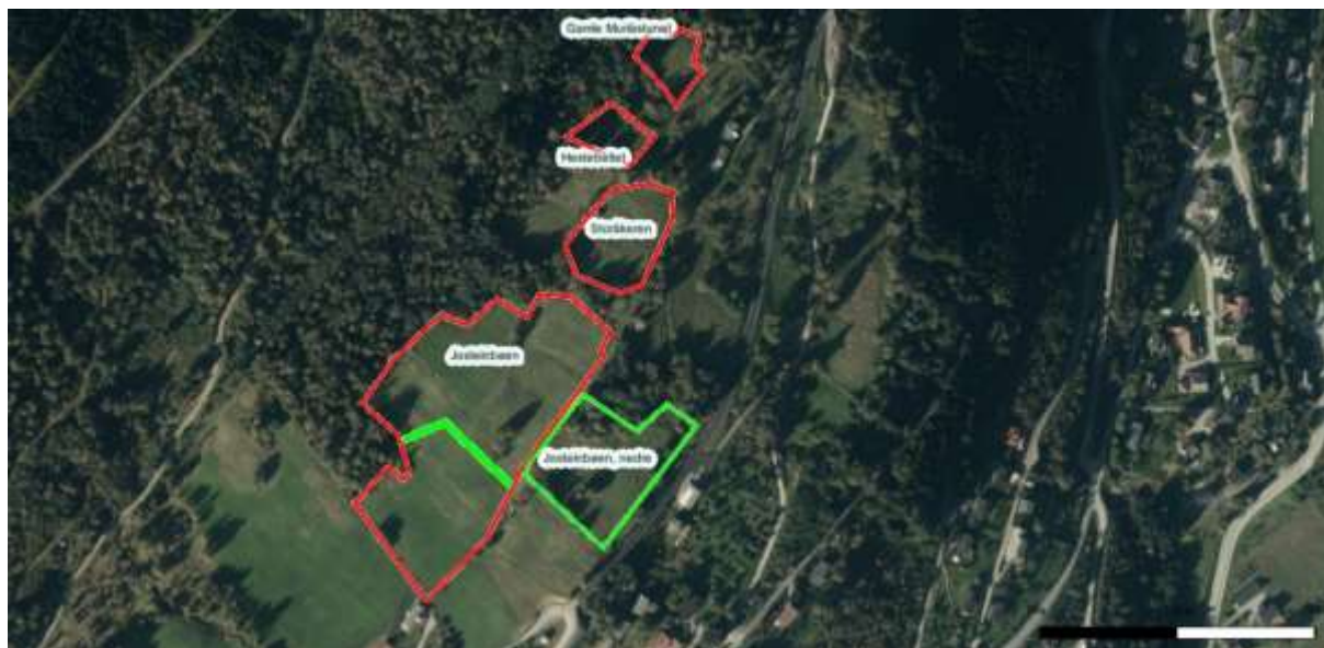
Figur 2. Den største av desse lokalitetane skal avgrensast mot sør, omlag der den grove grøne linja går. Lokaliteten som er avgrensa med grønt fekk vi ikkje sett på, men etter det vi har fått opplyst så har den omlag same kvalitetane som Josteinbøen. Den må difor sjåast på som ein potensiell slåttemarkslokalitet.