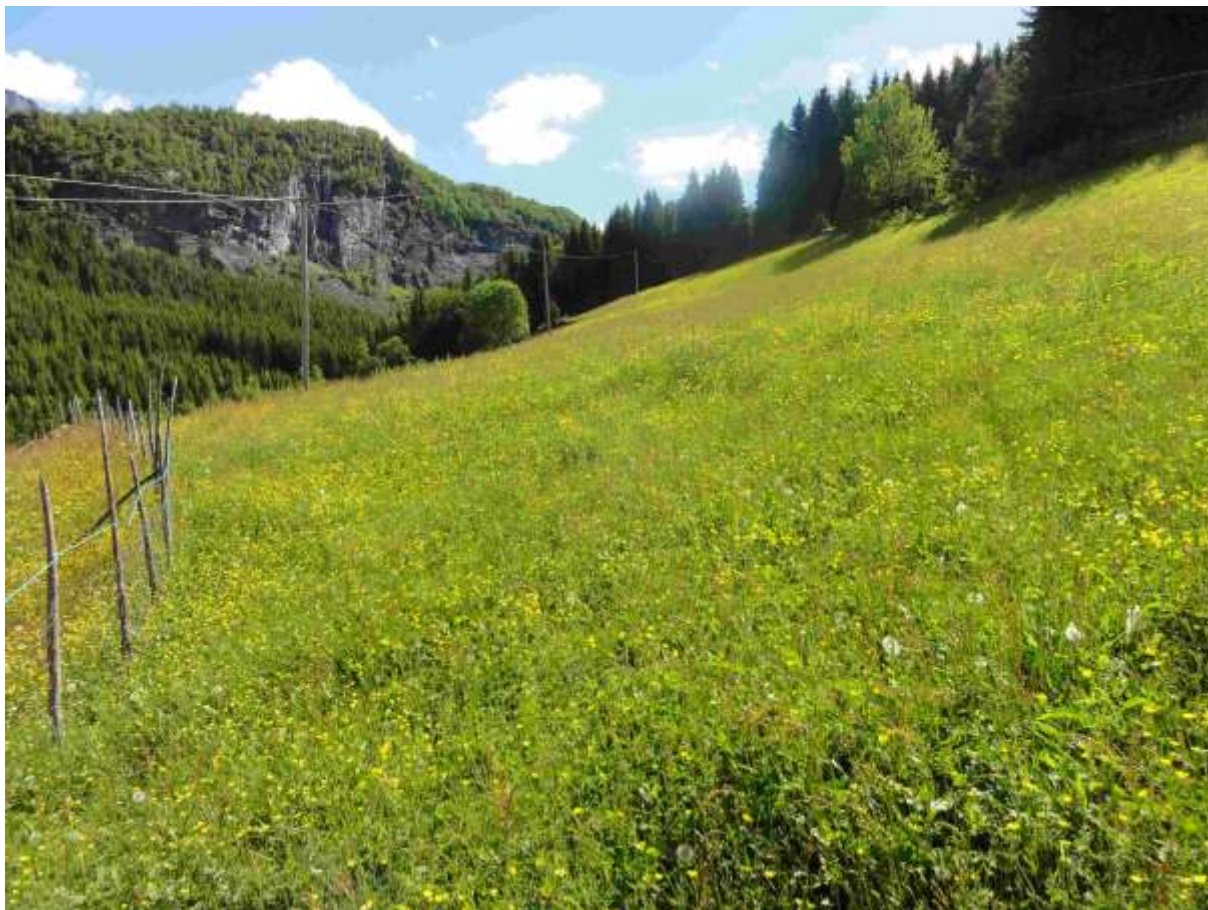
Figur 11. Øvstelia på Berge var godt oppgjødsla og vi såg ikkje noko restaureringspotensial i denne innan ein rimeleg tidshorisont.