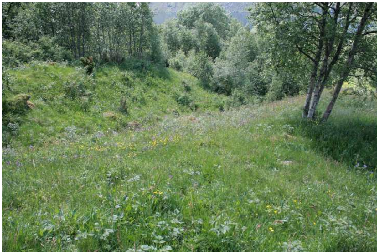
Figur 9. Strukturen peker klart i retning naturbeitemark. Viss arealet blir beita og rydda, vil det vere ei fin naturbeitemark, utan beiting og rydding av kratt er også naturbeitemarkverdiane snart borte.