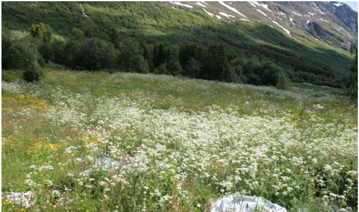
Figur 8. Dette biletet er frå teigen som ligg lengst mot nordaust på bnr 2 av Eide. Biletet er tatt frå ein stad i nærleiken av den første gule flekken lengst mot venstre på kartet på s. 9 (nr. 1). Arealet er ganske sikkert pløgd og gjødsla. Artane fortel om eit areal utan verdi som prioritert naturtype.

Etter å ha sett på teigen ved nordvestenden av Eidsvatnet, kørde vi vidare langs austsida der vi snudde. Den teigen som ligg lengst sør av gnr 65/2 vart så observert og vart funne å tilhøyra den intensivt drivne jordbrukslandskapet og var slik utan verdi som prioritert naturtype. Vi held så fram til teigen som ligg lengst nordaust av gnr 65/2, men også der kunne vi konstatera at mykje av teigen tilhørde det same intensivt drivne jordbrukslandskapet som teigen lenger sør. Det vart også sett på den delen av teigen som ligg mellom riksvegen og Eidsvatnet. Omtale av denne finst i billetteksta til framsidebiletet. Då det var litt vanskeleg å avstandsvurdera den øvste delen av teigen lengst mot nordaust, vart denne undersøkt nærare i felt. Sjå nærare vurderingar i billettekstene!