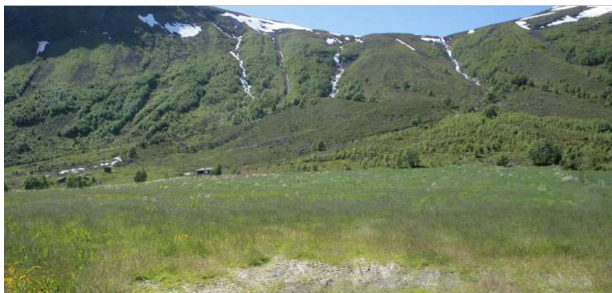
Figur 7. Den første lokaliteten vi såg på ligg ved nordvestenden av Eidsvatnet, men verken arealet vi ser i framgrunnen eller det som ligg nærare lia er aktuelle som naturtypen slåttemark.