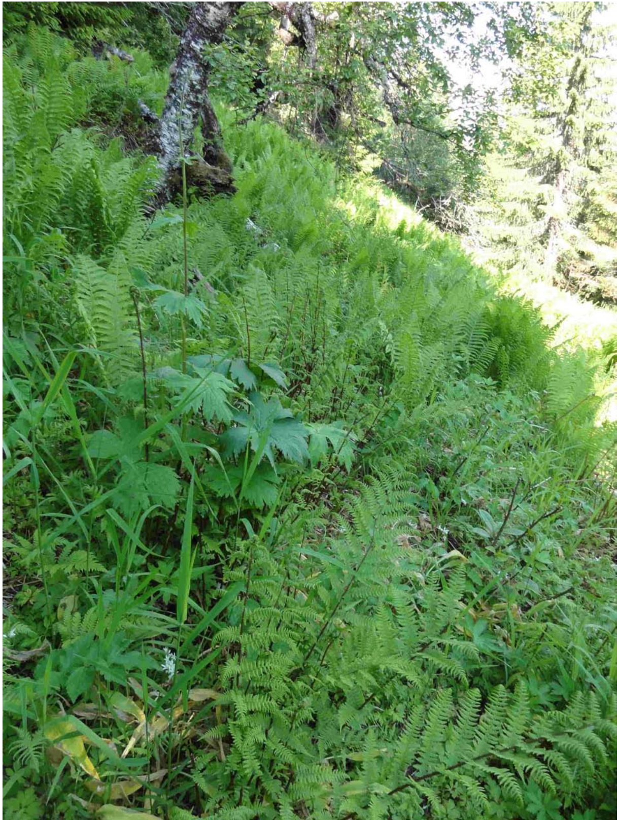
Figur 5. Dette bildet viser miljøet for ramslauk i Ramslia i Leksvik, Nord-Trøndelag. Typisk var storbregnemark med innslag av høgstaudar som tyrihjel, strandrør mfl..