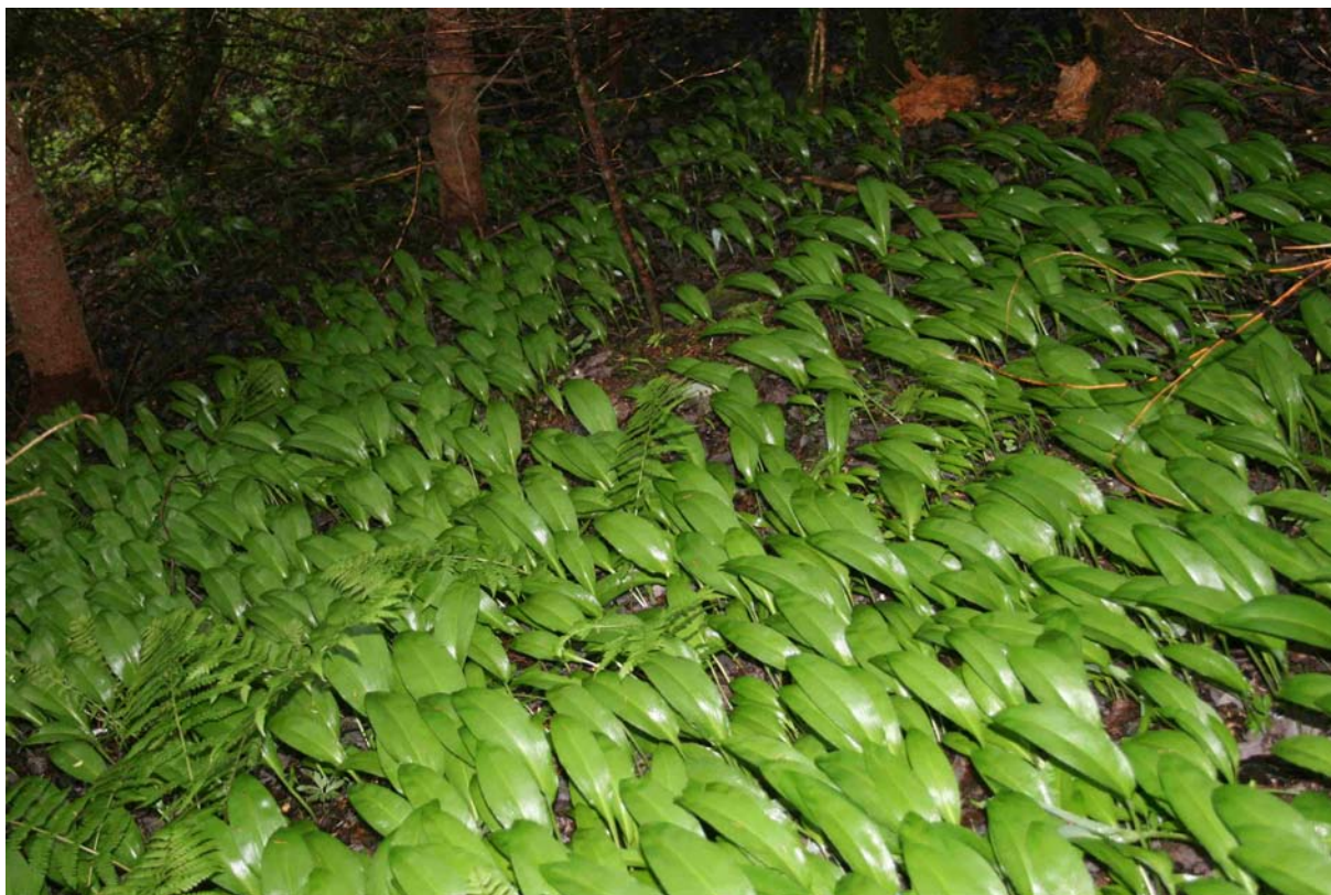
Figur 4. Her ser ein det litt særskilde miljøet ramslauken vaks i ved Ramsen, Stallvik i Bjugn, Sør-Trøndelag. Riktig nok var det ikkje berre gran i området, men også ein del boreale lauvtre som bjørk, rogn mfl. I følgje grunneigaren, så skulle det også vera litt alm i omegn..

Resultat; Fann mykje ramslauk, men ikkje ramslaukfluge.