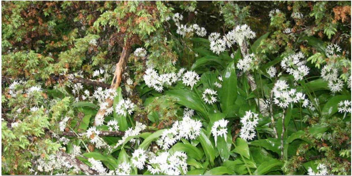
Figur 2. Biletet viser typisk miljø frå Bukkhellaren, lokaliteten på Storfosna i Ørland kommune, Sør-Trøndelag fylke.