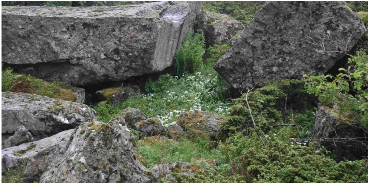
Figur 3. Også dette biletet er frå lokaliteten på Storfosna. Som ein ser så veks ramslauken mellom einer og storblokk på denne lokaliteten. (Foto; Karl Johan Grimstad ©).