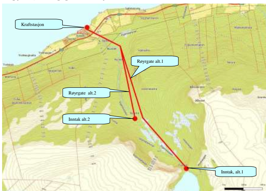
Figur 3. Kartutsnittet viser i grove trekk dei viktigaste naturinngrepa i form av inntak, røyrgater og kraftstasjon for dei to alternativa.