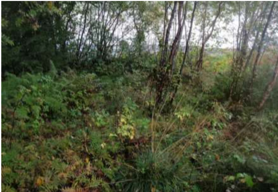
Figur 76. Biletet viser området kraftstasjonen er planlagt plassert. Dette området er forstyrra av hogst og andre aktivitetar. I tresjiktet finn ein for det meste bjørk, men også noko gråor, rogn og selje. I feltsjiktet er det ymse høgstaudar og bregner.

Som influensområde er rekna ei om lag 50 -- 80 m brei sone rundt inngrepa som er nemnd ovafor. Dette er ei relativt grov og skjønsmessig vurdering grunna ut frå kva for naturmiljø og artar i området som direkte eller indirekte kan verta påverka av tiltaket. Influensområdet saman med dei planlagde tiltaka (utbyggingsområdet) utgjer undersøkingsområdet.