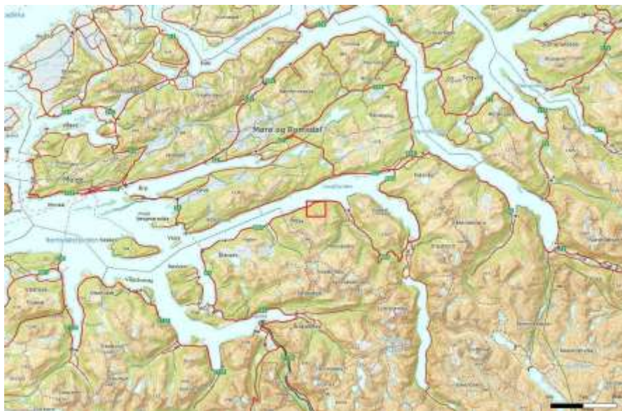
Figur 2. Den blå firkanten markerer utbyggingsområdet, og som ein ser så ligg området på sørsida av Langfjorden, ei forlenging av Romsdalsfjorden aust for Molde.