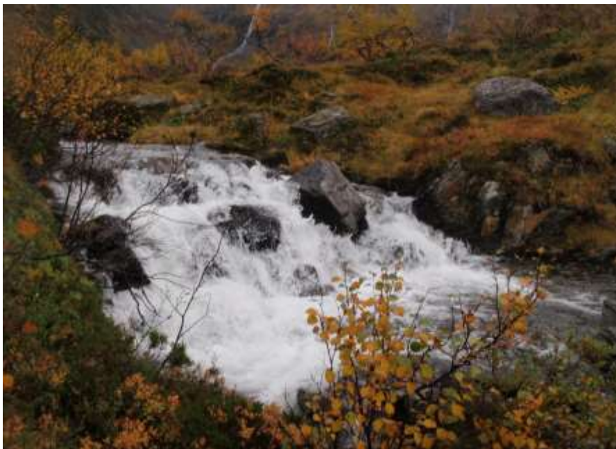
Figur 4. Biletet viser inntaksområdet, rett nedanfor Elgenesvatnet. Der er det for det meste blåbærskog med fjellbjørk i tresjiktet.

Utbyggingsplanane er motteke frå Norges Småkraftverk AS ved Olav Helvig.