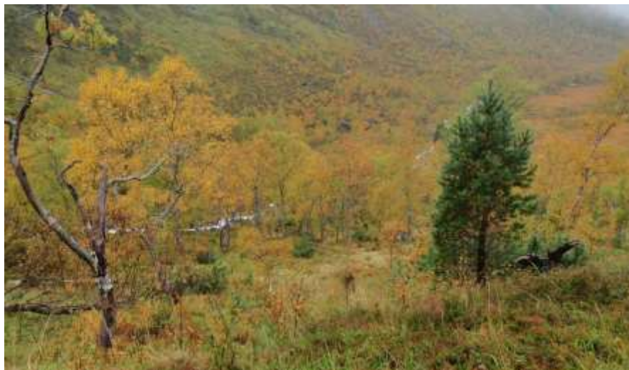
Figur 129. Biletet er teke eit lite stykke nedanfor inntaket, og viser eit utsnitt av røyrtraseen. Til høgre på biletet mellom furua og biletkanten kan ein sjå dei store myrene røyrgata er tenkt plassert over. Elvestrengen ser ein like til venstre for furua. Som avbøtande tiltak har ein tilrådd at røyrgata blir trekt lenger ned mot elva slik at minst mogleg av myrområda risikerer å bli drenert.