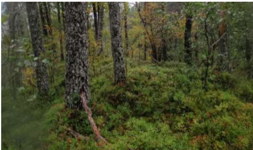
Figur 1110. Biletet viser eit utsnitt av vegetasjonen omlag 150 moh. Her er det mest blåbærfuruskog, men stadvis også høgt innslag av bjørk.

Konklusjon for mosar og lav. Vi har fått undersøkt det meste av terrenget langs elvene og meiner å kunne fastslå at potensialet for sjeldne moseartar som er særskild avhengig av høg luftfukt berre i liten grad er til stades i influensområdet for dette prosjektet. Det er ikkje påvist artar av lav som indikerer at det kan vera miljø her som er sterkt avhengig av at vassføringa i elva vert oppretthalde på same nivå som no.