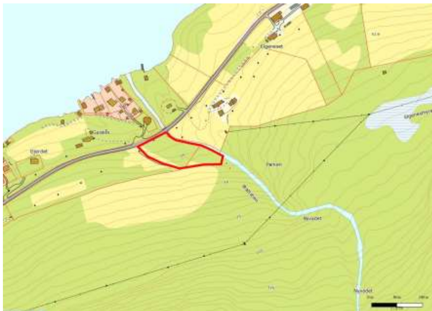
Figur 136. Kartet viser den avgrensa gråor-heggeskogen ved Gussiås.

Den nedste delen av utbyggingsområdet er, bortsett frå lokalitet 1, prega av menneskelege aktivitetar, m.a. granplanting, vegar, gardstun, bustadhus m.v. Omlag frå 300 moh. og oppover er vegetasjonen nokolunde intakt, men triviell.