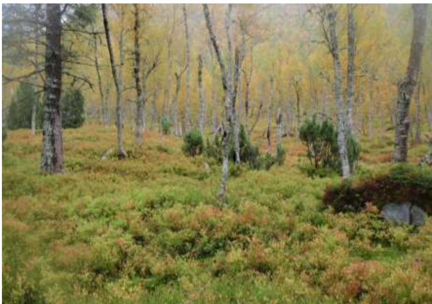
Figur 55. Biletet viser typisk vegetasjon omlag ved 350 moh. Der er det mindre furuskog, og bjørka dominerer i tresjiktet. I feltsjiktet er det blåbærlyngen som dominerer. Ein ser også at det er mykje einer i området.

Datagrunnlag er eit uttrykk for kor grundig utgreiinga er, men også for kor lett tilgjengeleg opplysningane som er naudsynte for å trekkja konklusjonar på status/verdi og konsekvensgradar er.