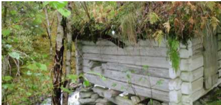
Figur 6. Biletet viser eit restaurert kvernhus eit lite stykke ovanfor riksvegen.