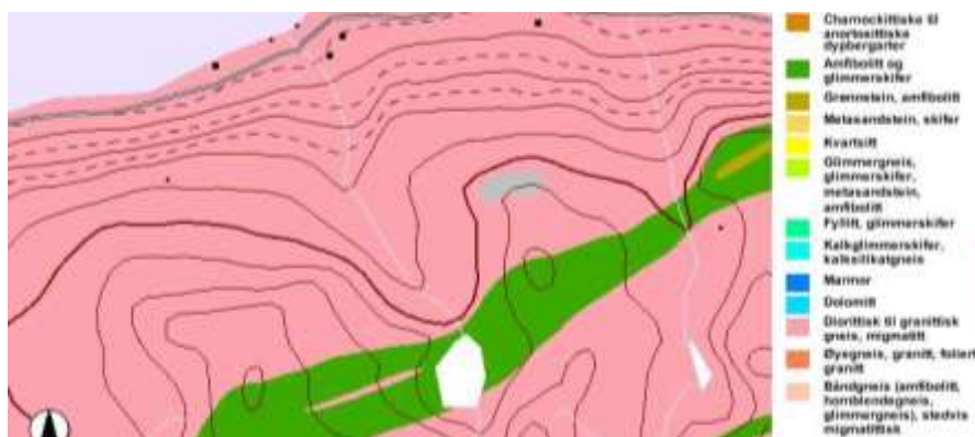
Figur 89. I fylgje berggrunnskartet, så er det diorittisk til granittisk gneis og migmatitt som dominerer i det meste av utbyggingsområdet. Desse bergartane gjev normalt berre grunnlag for ein fattig flora. Ved inntaket er det noko amfibolitt og glimmerskifer, desse bergartane kan gi grunnlag for ein litt rikare flora.

Berggrunnskartet viser at det er bergartar frå jordas urtid og oldtid (proterozoikum og paleozoikum) overskua under den kaledonske fjellkjedefoldinga som dominerer. Meir spesifikt består bergartane i utbyggingsområdet for det meste av diorittisk til granittisk gneis og migmatitt. Desse bergartane gjev normalt berre grunnlag for ein ganske fattig flora. Ved inntaket er det noko amfibolitt og glimmerskifer. Denne bergarten kan gje grunnlag for ein noko rikare flora.