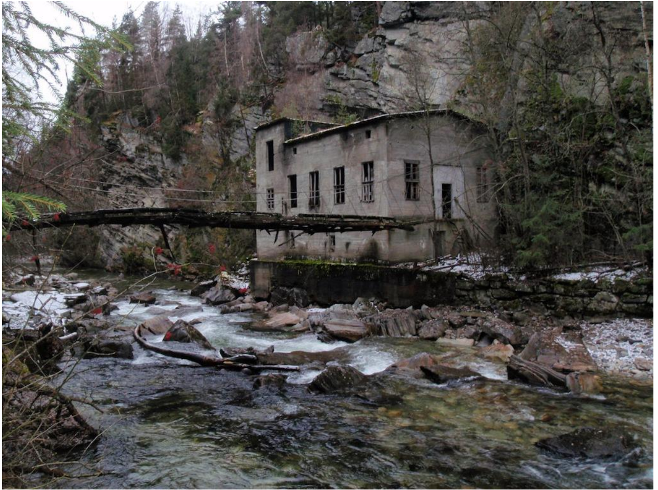
Figur 2. Biletet viser den gamle kraftstasjonen i Frya. Ved ei ev utbygging skal den nye stasjonen plasserast her ein stad.

Store delar av hølen, inkludert utløpa har eit substrat av stein (opp til 10-15 cm) grus, og sand. Nedanfor hølen blir elva betydeleg raskare, med raske stryk/småfossar og fleire mindre kulpar. Her er substratet gjennomgåande grovare, med mykje stor stein liggande i elveleiet. Men i kulpane er det også lommar med grus og småstein. Elva blir rolegare igjen noko nedanfor stasjonsområdet. Derifrå renn ho i rolege stryk og grunne hølar ned til Lågen. Heile denne strekninga har eit blandingssubstrat av stein og grus.