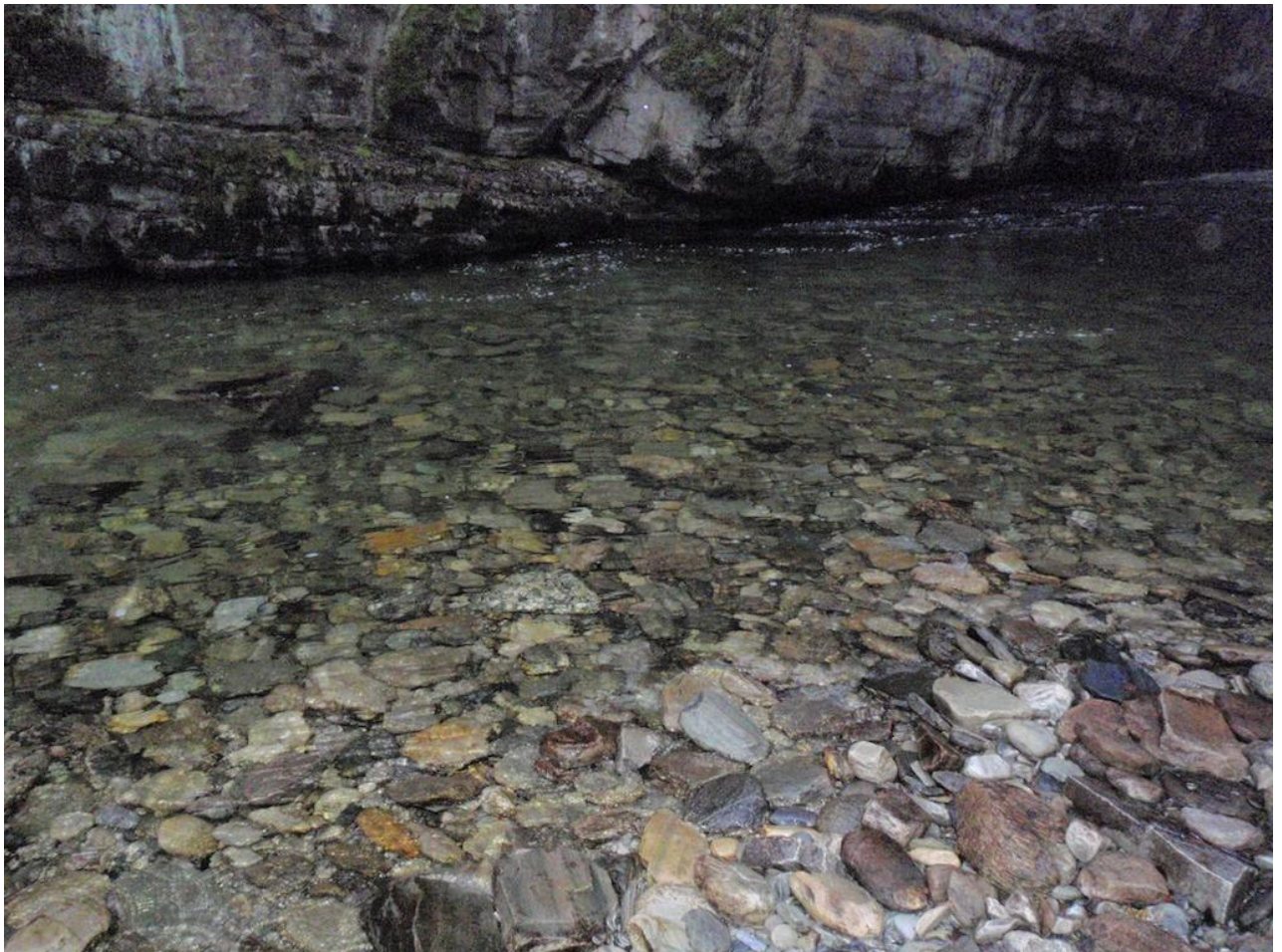
Figur 5. Biletet viser brekket ved utløpet av Bergsveinhølen. Dette området er eit særst godt gyteområde, og det er dokumentert høg tettleik av yngel der.

Konklusjonen må difor bli at dei viktigaste gyteområda for storaure i Frya truleg ligg ovanfor stasjonsområdet. I samband med dette er det viktig å hugse at ein populasjon med storaure i eit vassdrag ofte er sett saman av fleire stammar, der kvar stamme brukar sitt eige gyteområde (Garnås m. fl., 1996). For å taka vare på det biologiske mangfaldet må difor forvaltninga av storauren vere stammeorientert på same måte som hos laksen. Gyteområda i Frya er difor grunnlaget for å taka vare på denne storaurestammen.